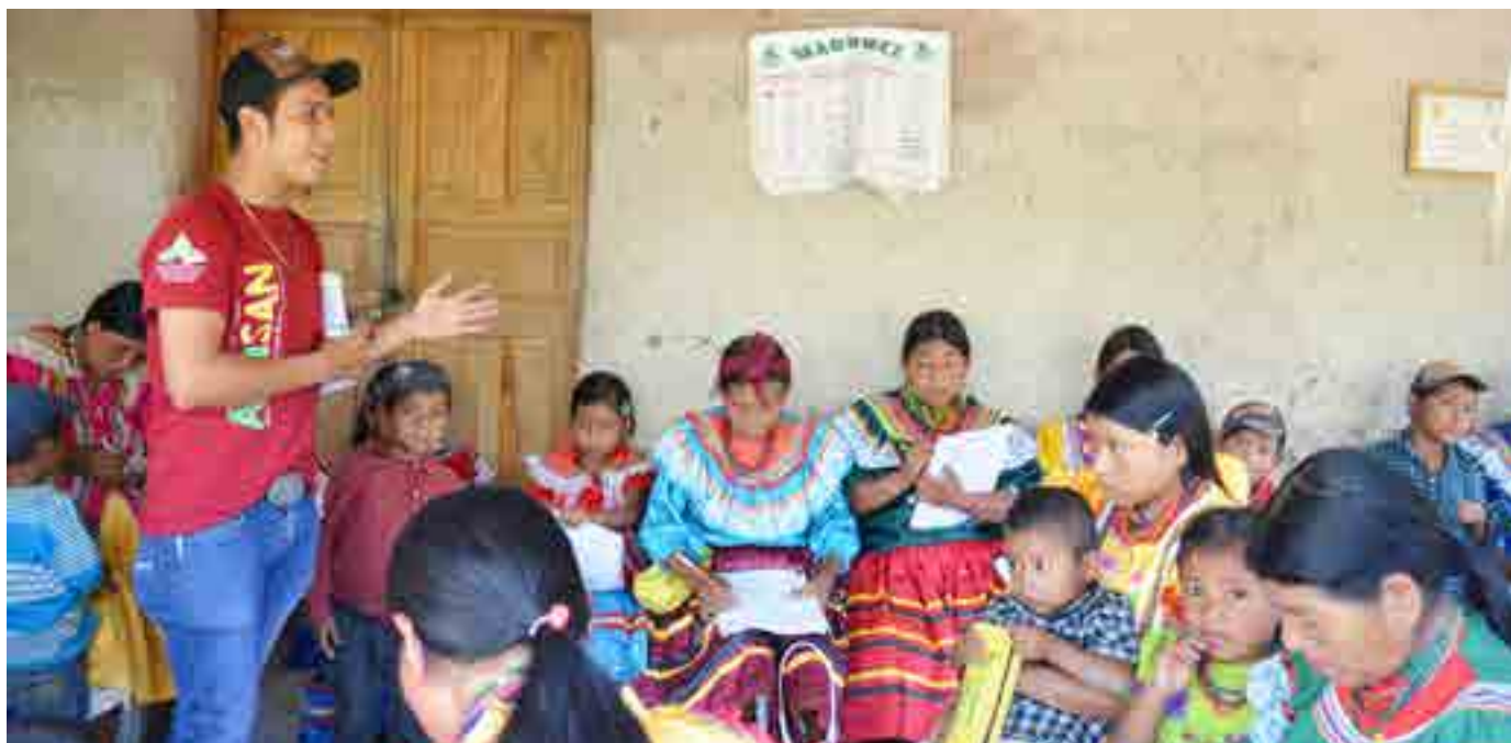
Círculo de alfabetización en Camotán, Guatemala, Programa AlfaSAN

La Mancomunidad Trinacional en cada una de sus Políticas Públicas Locales Transfronterizas, PPLT, proyectos y programas, promueve la participación activa de las personas de la comunidad, basada en el sistema de derechos y responsabilidades, establecido constitucionalmente por el Estado y moralmente por la comunidad. Hoy con esta nueva política que es parte de proceso multidimensional, junto a cada uno de los actores participantes, profundizará aún más la alfabetización y post alfabetización de personas adultas (el cual ya hacemos en el programa AlfaSAN), impulsaremos la Escuela Trinacional de formación para el desarrollo de comunidades educativas y solidarias, la formación de liderazgos políticos, sociales, económicos, ambientales y culturales, y se fomentará la organización para la autogestión comunitaria en los ámbitos político, social, económico, ambiental y cultural.