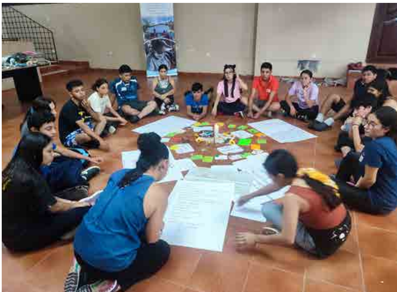
Taller de formación en gestión cultural y artística, Programa AnimARTE.