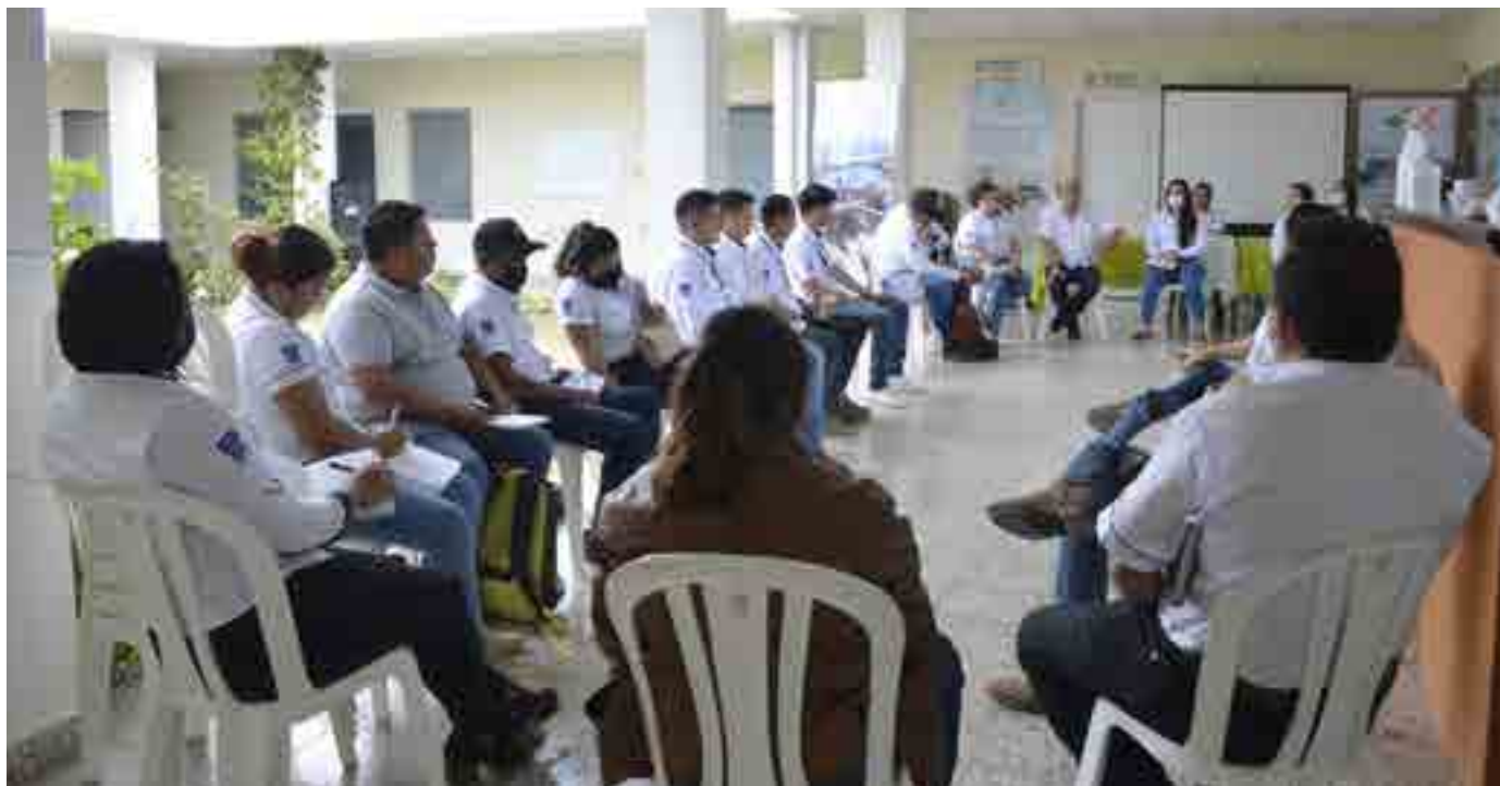
Reunión de coordinación técnica del equipo de trabajo de la Mancomunidad Trinacional Fronteriza Río Lempa