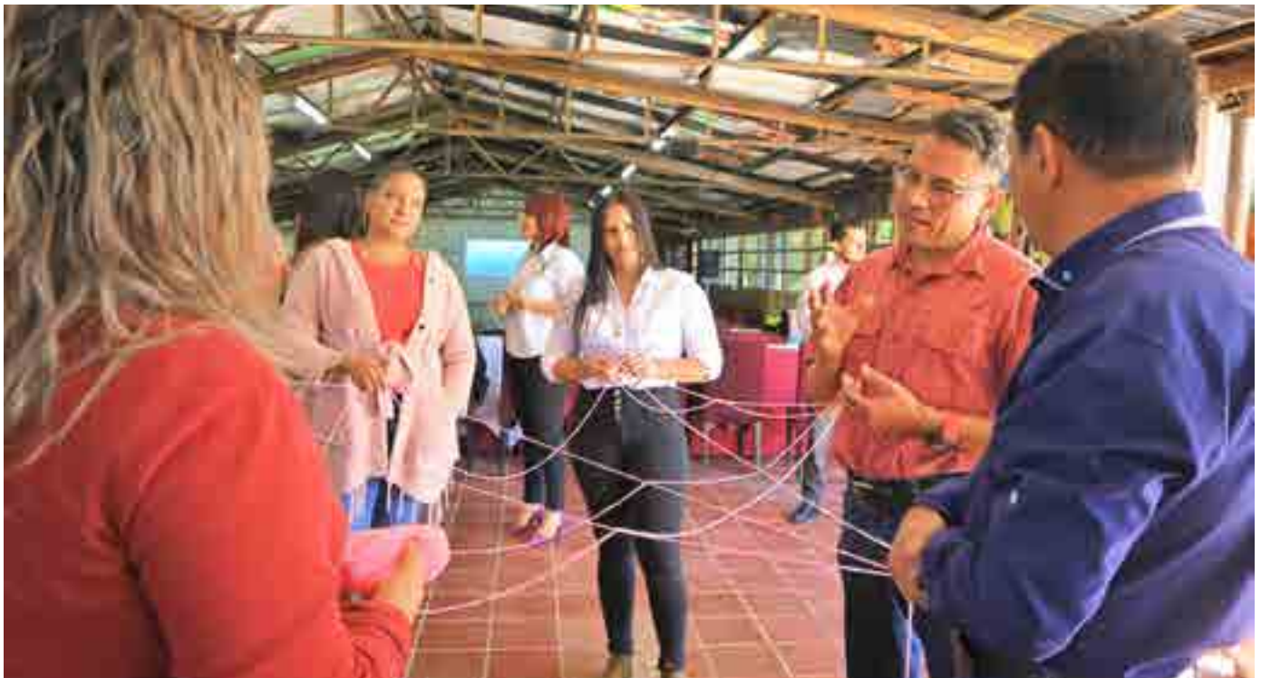
Taller con docentes de los tres países sobre metodología y educación, facilitado por la Universidad Pedagógica Nacional Francisco Morazán.

En el proceso de formulación y ejecución de las políticas públicas es necesario presentar propuestas de instrumentos y mecanismos operativos que aseguren su implementación, esto puede darse en el nivel trinacional y nivel municipal. Lograr el desarrollo y funcionamiento de estos instrumentos y mecanismos es un signo de apropiación de las políticas, el número de instrumentos por elaborar dependerá del tema de política, del contexto y los recursos disponibles; estos instrumentos deben ser reglamentados e incorporados en el documento de la política pública.