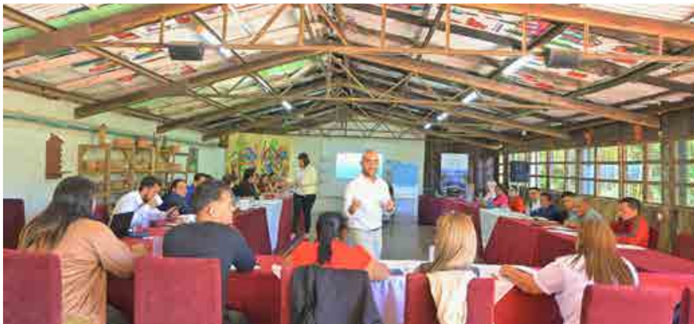
Taller con docentes de los tres países sobre metodología de educación, facilitado por la Universidad Pedagógica Nacional Francisco Morazán.