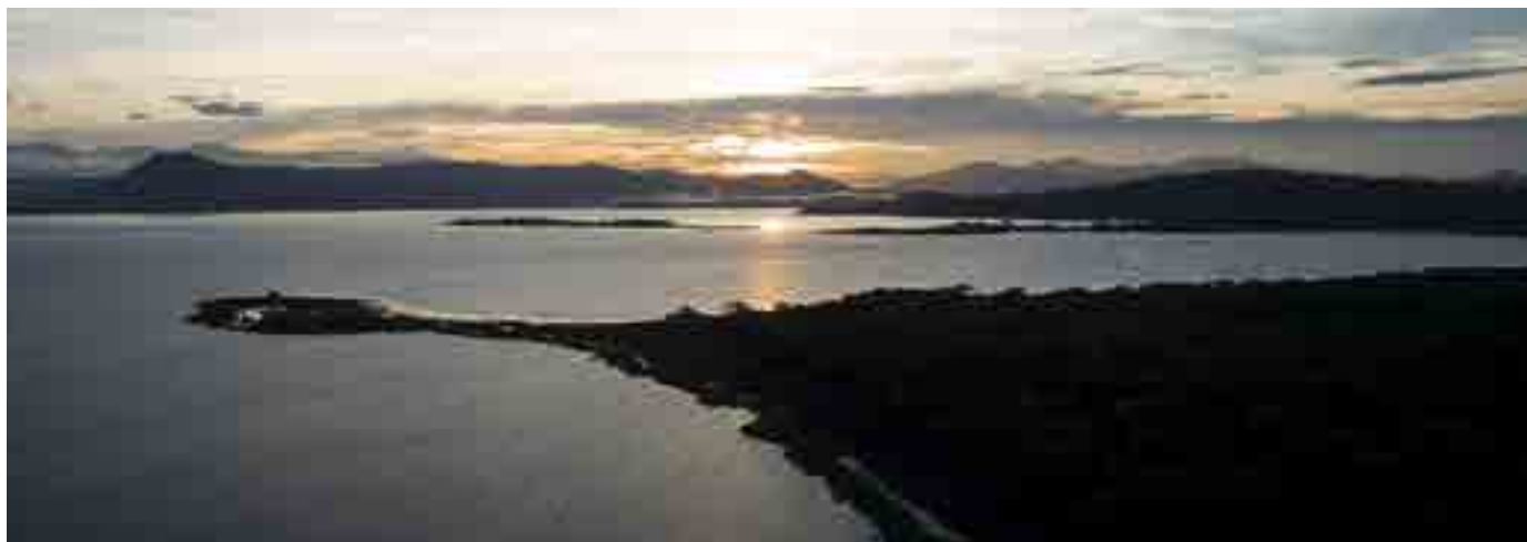
Foto del Lago de Güija, Metapán, El Salvador

En el desarrollo de la experiencia con Políticas Públicas Locales Transfronterizas, se han marcado los siguientes hitos importantes.