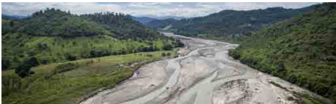
Foto del Río Lempa.

En 2013, la Mancomunidad gestionó y obtuvo un proyecto trinacional para la Seguridad Alimentaria y Nutricional, SAN, conocido como "Hambre Cero"; esta fue la oportunidad para que los gobiernos locales y sus aliados incursionaran en el abordaje integrado de la problemática social del territorio. Con el proyecto se aprobó la Política Pública Local Transfronteriza "Hambre Cero" y los instrumentos para su implementación con el cual se contribuyó al fortalecimiento de la gestión y cohesión territorial a partir del abordaje mancomunado e interinstitucional de la INSAN.