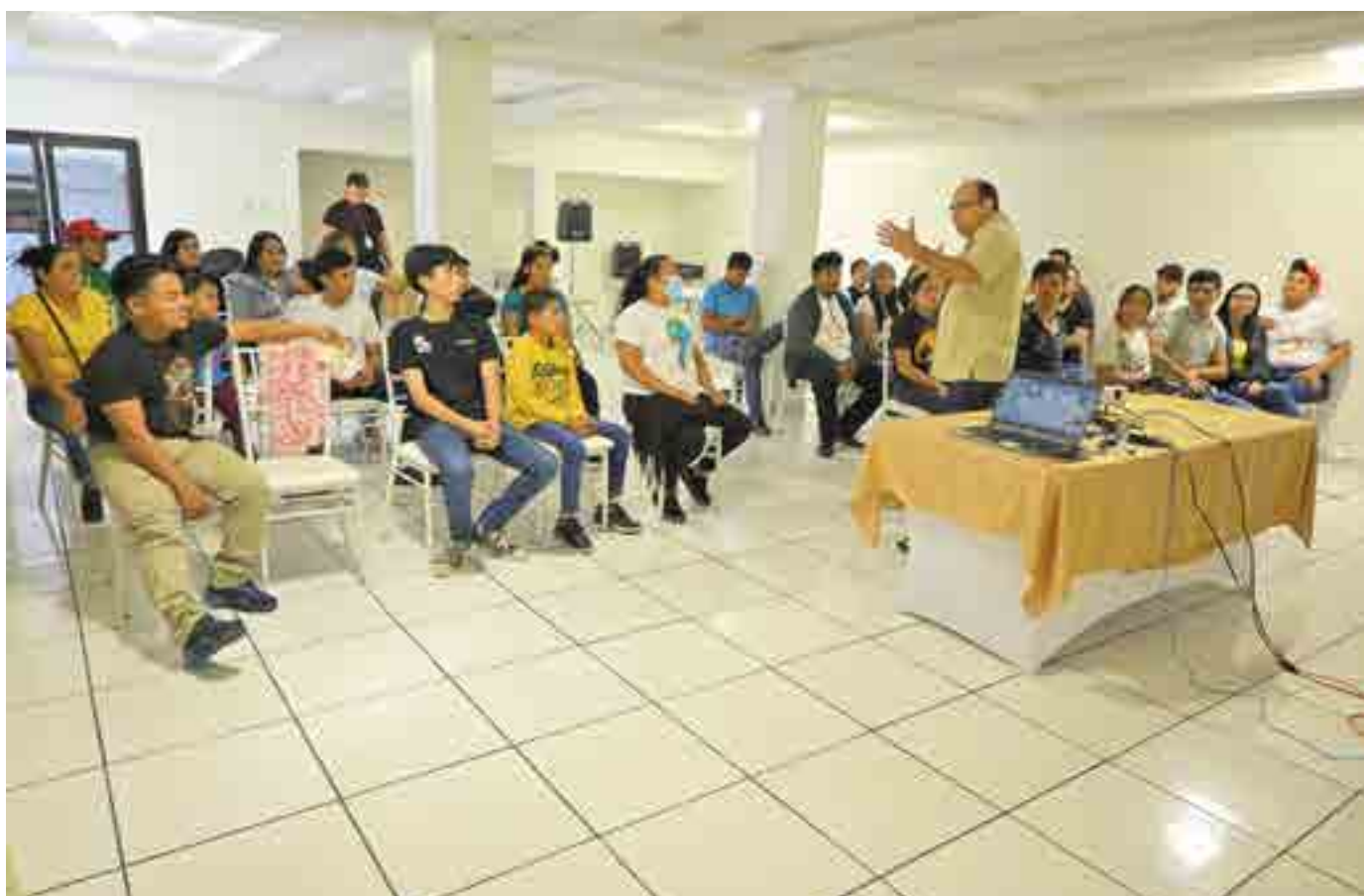
El gerente de la MTFRL, en el taller de sensibilización a grupos artísticos sobre Cultura de Paz y el rescate del río Lempa, parte del plan piloto de la política.