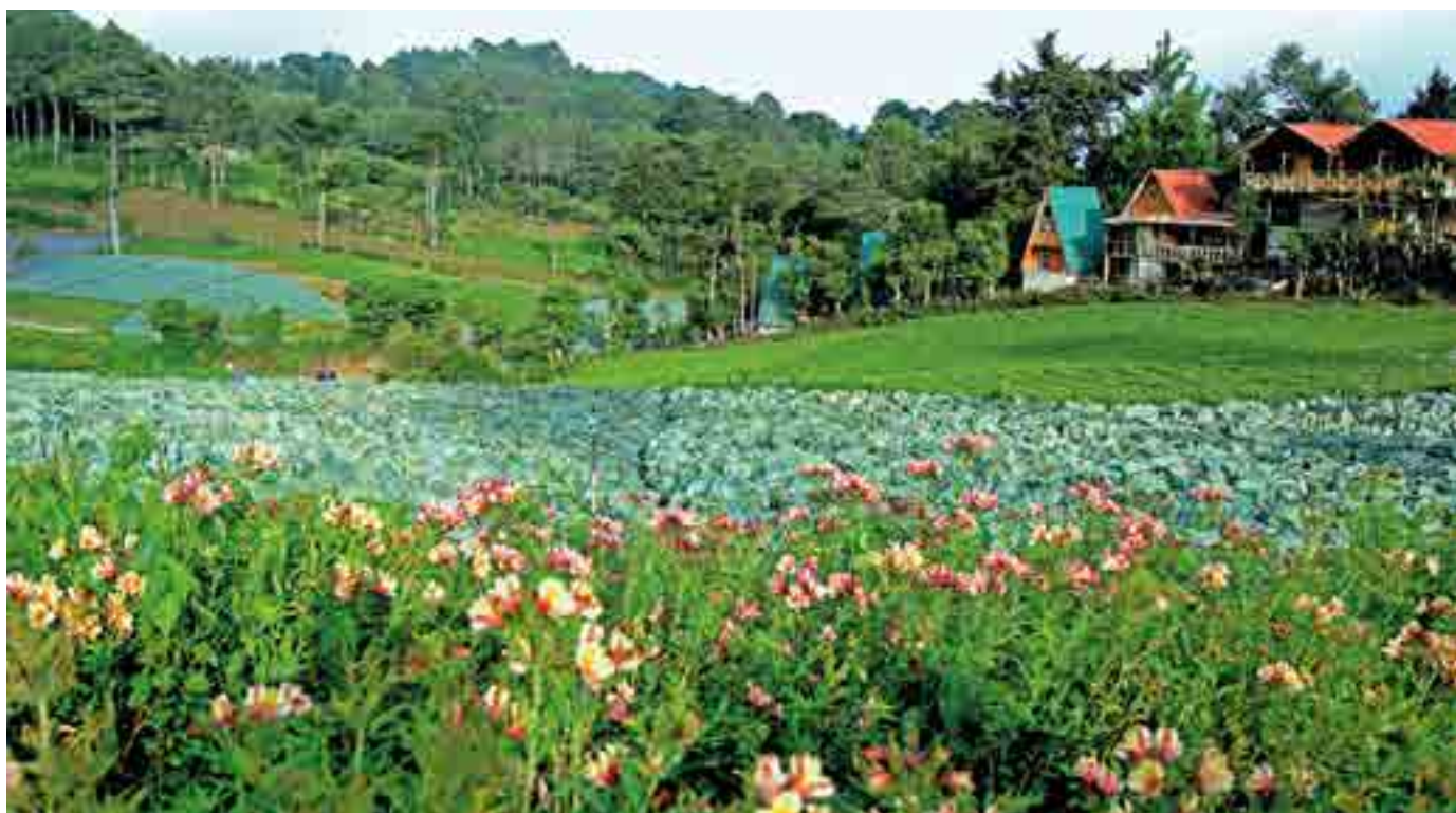
Cultivos agrícolas San Ignacio, Chalatenango, El Salvador.