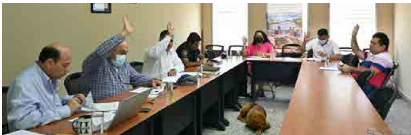
Reunión de Junta Directiva de la Mancomunidad Trinacional Fronteriza Río Lempa, en oficinas de Sinuapa, Honduras.