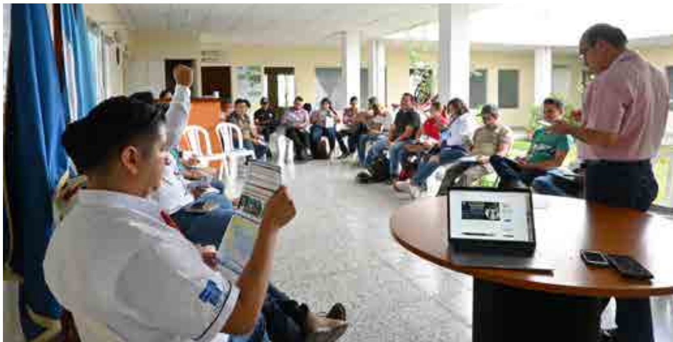
Reunión de coordinación técnica del equipo de trabajo de la Mancomunidad Trinacional Fronteriza Río Lempa

Un hecho que favoreció el diseño de la política fue la gestión del "Proyecto Articulación comercial del sector artesanal en el Trifinio Centroamericano", financiado por la Unión Europea por medio de una subvención del Programa AL INVEST 5.0. El proyecto inició en 2017 y la política DETI se formuló en los primeros meses del 2018, constituyéndose en uno de sus principales resultados; de esta manera el territorio Trifinio ya dispone de un instrumento jurídico que puede orientar las acciones del desarrollo económico territorial.