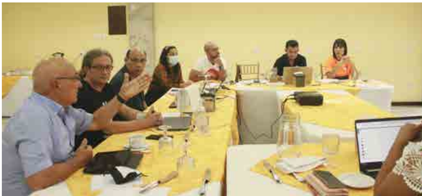
Especialistas en educación de Escuelas Solidarias, en reunión de trabajo con docentes universitarios de Guatemala y Honduras.

Establecer desde el gobierno local, las articulaciones con entidades de educación media y superior, así como con organizaciones de la sociedad civil y cooperación internacional, para fomentar el acceso a la educación media y superior de jóvenes de escasos recursos económicos, para el abordaje de las disparidades de ingresos, nivel de pobreza, autonomía y poder político; principalmente de los grupos más vulnerables por su condición de género.